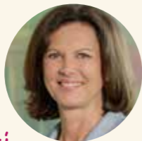
Ilse Aigner Landtagspräsidentin, MdL, CSU

Ein inspirierender Tag von Frauen für Frauen!