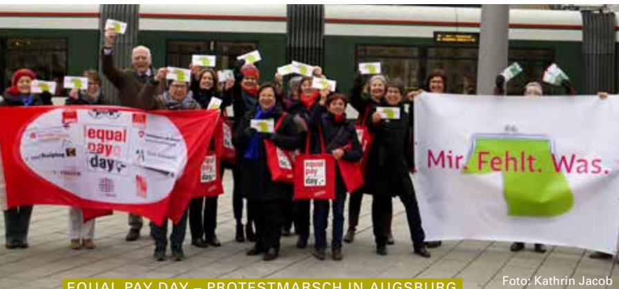
EQUAL PAY DAY – PROTESTMARSCH IN AUGSBURG